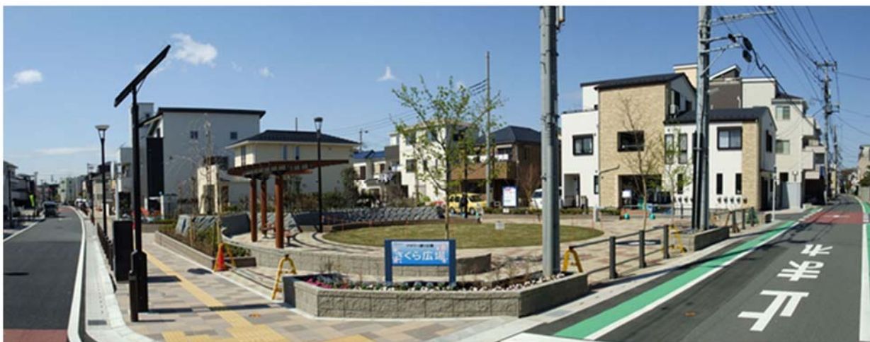
整備、拡幅された道路・地域のコミュニティ「さくら広場」(新設)